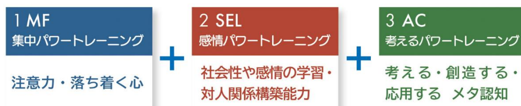
SEL を中心に MF(マインドフルネス)AC(アカデミックコンピテンシー)の3つのメソッドを融合

どうか、みらいグロースのトレーニングで、子ども達に、自分自身の能力をアンロック(解錠)することで能力のベースアップをはかることが期待できます。