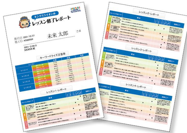
レッスン内及びレッスン前後でのアセスメント結果をもとにした評価レポート

この記録は、専門家のチェックにより担当責任者にフィードバックされます。受講以前と以後の違いに基づき、必要に応じて専門家が効果的な助言を行います。