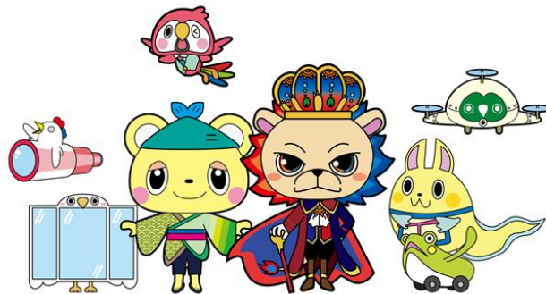
みらいグロースをナビゲートするキングミライオン、ココロッチなどのキャラクター